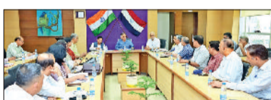
रोहतक। डीन एवं स्टैट्यूटरी अधिकारियों के साथ महत्वपूर्ण बैठक लेते कुलपति प्रो. मिलाप पुनिया।

जिले में ग्रामीण विकास कार्यों में प्रगति : उपायुक्त रोहतक। उपायुक्त सचिन गुप्ता ने कहा कि जिले के ग्रामीण क्षेत्रों में विकास कार्य निरंतर आगे बढ़ रहे हैं और आधारभूत ढांचे, स्वच्छता व आजीविका से जुड़े प्रयासों में सुधार देखने को मिल रहा है। वे शुक्रवार को लघु सचिवालय में विकास एवं पंचायत तथा ग्रामीण विकास विभाग की समीक्षा बैठक की अध्यक्षता कर रहे थे। उन्होंने बताया कि प्रधानमंत्री आवास योजना (ग्रामीण) के तहत 1405 मकानों के लिए पहली और 541 मकानों के लिए दूसरी किस्त जारी की जा चुकी है, जबकि योजना के अंतर्गत 1525 लाभार्थी पंजीकृत हैं। अमृत सरोवर योजना के तहत 51 सरोवरों का जलौद्वार किया जा चुका है और 10 पर कार्य जारी है, जिससे ग्रामीण क्षेत्रों में जल संरक्षण और सामुदायिक सुविधाओं को मजबूती मिल रही है। उपायुक्त ने अधिकारियों को निर्देश दिए कि खराब गांव में स्थापित गोबरघाट परियोजना के अंतिम चरण के लिए जल्द शुरू किया जाए। यहां लगभग 648 किलोमीटर लंबी गैस पाइपलाइन बिछाई गई है, जिसकी क्षमता 100 कनेक्शनों की है।