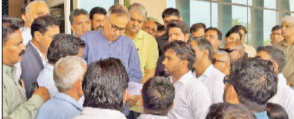
रोहताक। कुलपति को ज्ञापन सौंपते महापंचायत के सदस्य।