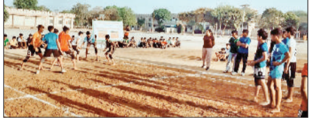
कबड्डी प्रतियोगिता में भाग लेते प्रतिभागी।