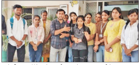
नेकीराम कॉलेज में प्रदर्शन करते एसएफआई के सदस्य।